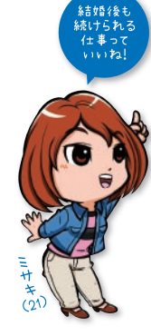
結婚後も続けられる仕事っていいね!